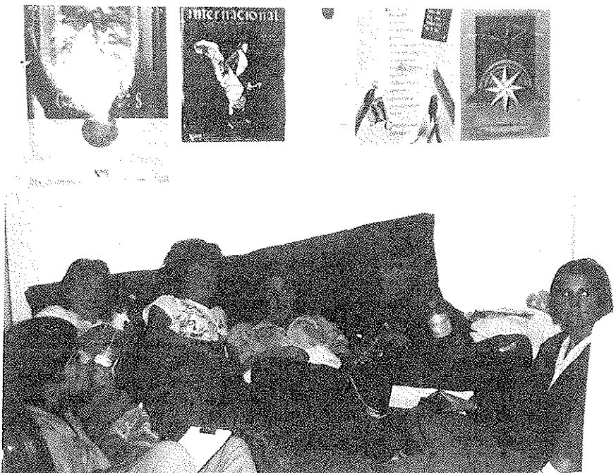
Traballadoras en folga de fame, pechadas no Concello de Vilanova (10.10.90)