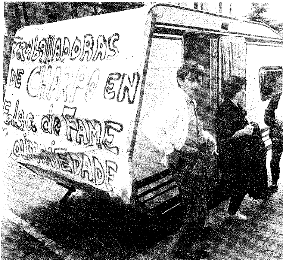
Traballadoras en folga de fame, diante do Parlamento.