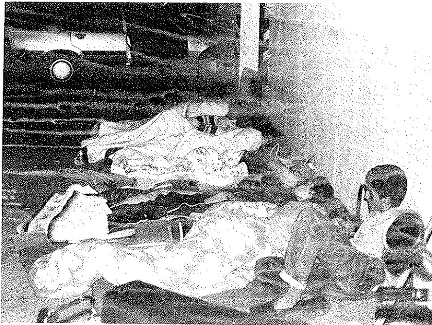
Traballadoras durmindo na porta da fábrica antes de sere apaleadas (20.9.90)