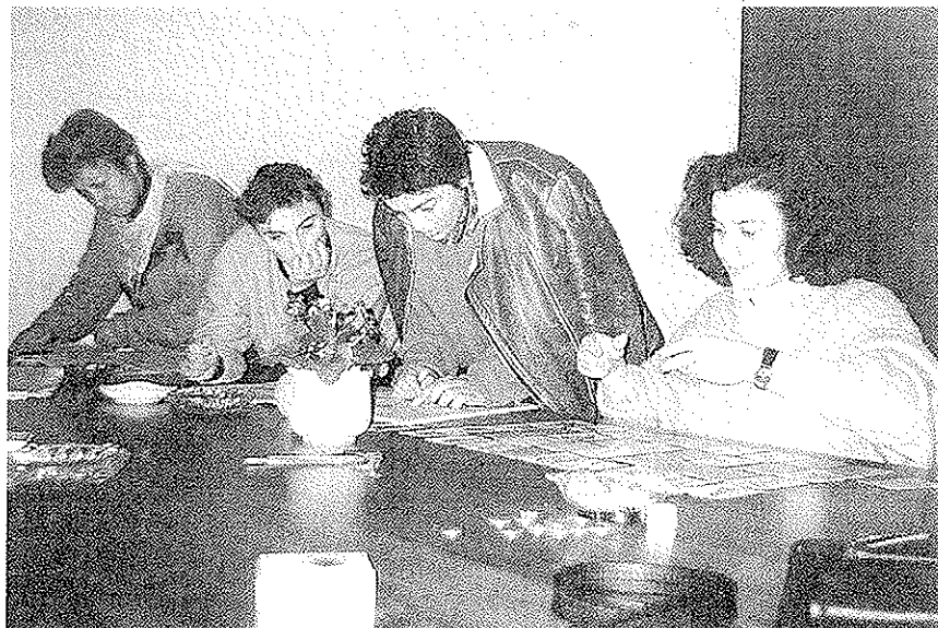
As traballadoras durante algúns momentos do peche

Por outra banda, e para complicar aínda máis as cousas, en xullo deste ano, a Tesourería da Seguridade Social, aproveitándose dun erro dos avogados de CC.OO. e C.I.G., que levaban anteriormente o despido —non renovar a anotación do embargo no Rexistro da Propriedade—, anuncia que saca a subasta o cocedeiro de Charpo para cubrir a débeda das cotizacións que xerara o despido do 93. ¡INCREDIBLE, PERO CERTO! As cotizacións á Seguridade Social que xeran os propios salá-