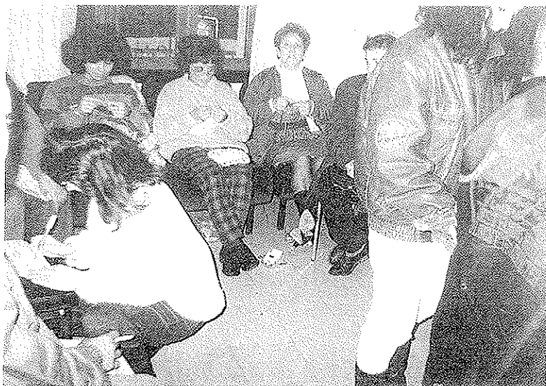
As traballadoras durante algúns momentos do peche

Os primeiros contactos cos novos administradores xudiciais foron esperanzadores. Dicían que confiaban na viabilidade do cocedeiro, que era un sector en auge na comarca, que precisaban algo de tempo para xestionar a financiación, que se comprometían a falar coa Consellería de Industria para que apoiase un Plano de Viabilidade, e que as traballadoras pronto serían chamadas a traballar. Moi boas palabras, pero só palabras. Os administradores xudiciais, non souperon ou non quixeron buscar a viabilidade da empresa e, en maio do 99 DESPIDEN a toda a plantilla de Charpo (ás malas e ás boas) utilizando os argumentos de sempre, os dos Charlíns: que non hai liquidez,