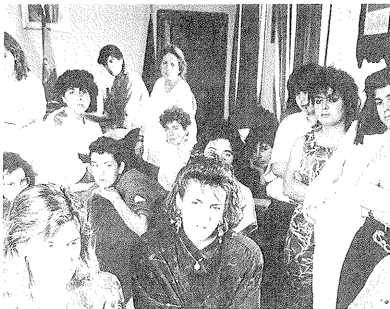
Peche das traballadoras de Charpo, 1990

Os Charlíns néganse sistemáticamente a cumprir a sentenza do 93 e durante cáseque tres anos NEN PAGAN, NEN READMITEN. Neste