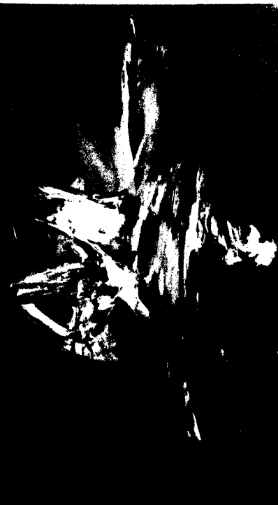
Manuel Viola. — Año 1959 "Profecía" (192x275 cm.)