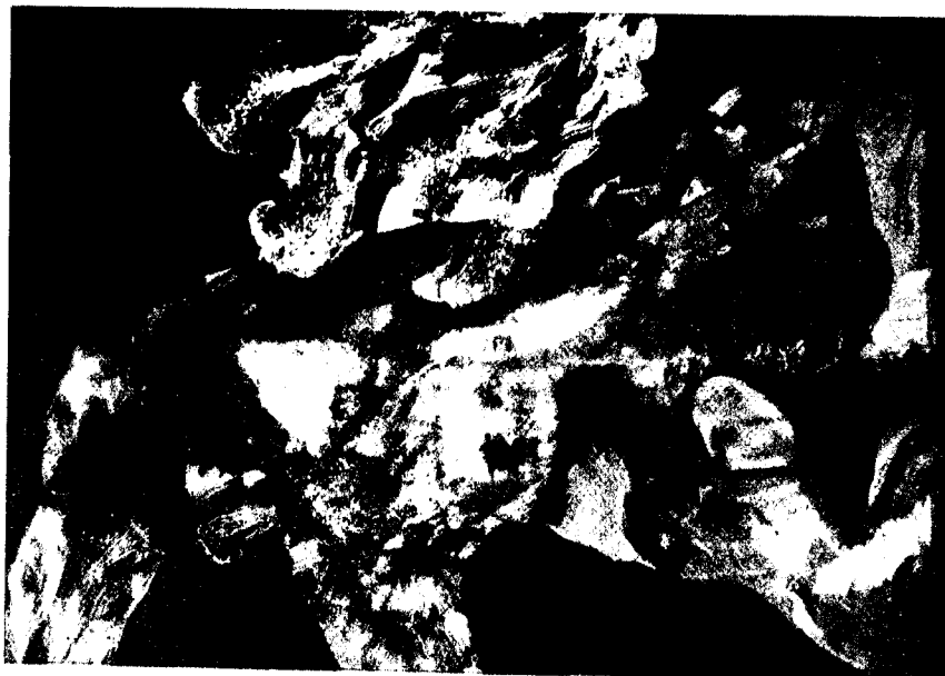
Vaquero Turcios. — "Hombre en llamas"

Si hay una pintura de concepción realmente arquitectónica es la de Vaquero Turcios. El plástico se ha volcado, plenamente, al mural. No toda la pintura cuya finalidad es la de cubrir muros más o menos amplios es ya, necesariamente, mural. Estamos habituados a encontrar grandes plafones cubiertos por la mancha, la línea y el color, cargados de anécdota mimimizadora. Son como ampliaciones de los antiguos cuadros de género. Temas y tratamientos más aptos para cubrir íntimos y domésticos biombo que para extenderse por la limpia superficie del muro. En estos casos, de todo punto recusables, falta algo tan primordial como es el concepto. Vaquero Turcios, a quien seguimos