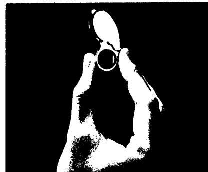
Guardiola. — Anillo de plata pulida