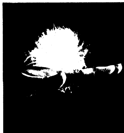
Capdevila. — "La joya como diseño". Museo de Arte Contemporáneo