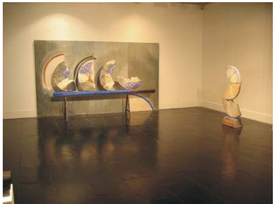
Paisaje gris, (1998-99) Refractorio, esmalte, hierro y madera)

E.C.: Ahora estoy con los ladrillos, construyo con ellos. Llevo ya unos años que no trabajo con el barro. Empecé construyendo con mi propio material, es decir,