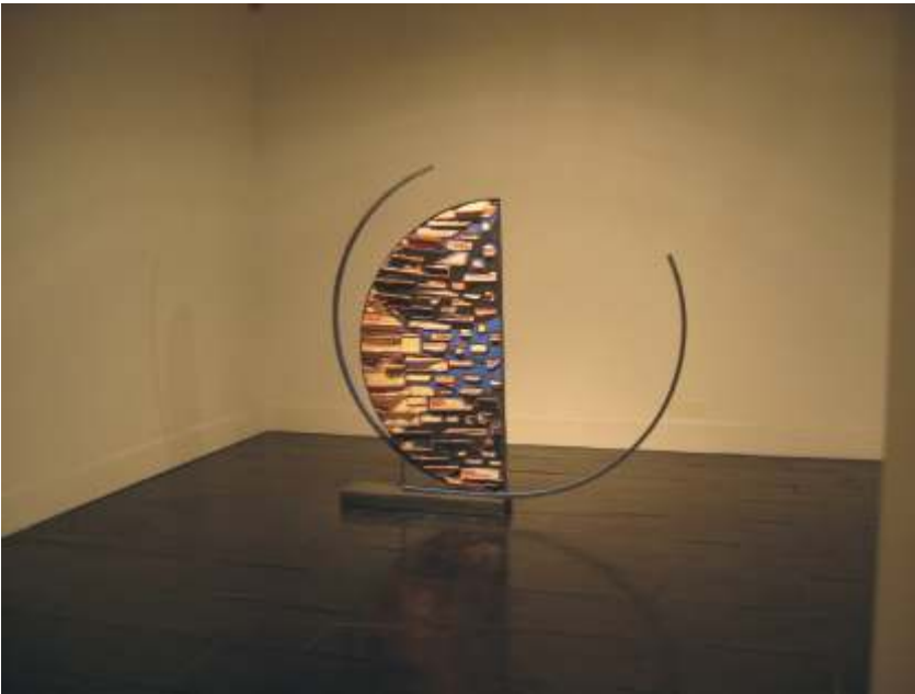
Esfera II (2002-3) Ladrillos, cemento, óxidos y hierro

C.B.: Observando tu obra se aprecia un aspecto técnico extraordinario, aunque empiezas construyendo el volumen añadiendo barro, modelando, torneando, finalmente terminas utilizando la talla y construyendo con elementos, con fragmentos cerámicos. ¿Cómo surge este cambio? ¿Por qué?