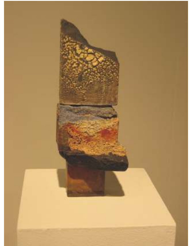
Verticales (2002-3) Refractario, óxidos y esmaltes

Nacional de Cerámica, estudiando los seis años que comprendía la carrera.