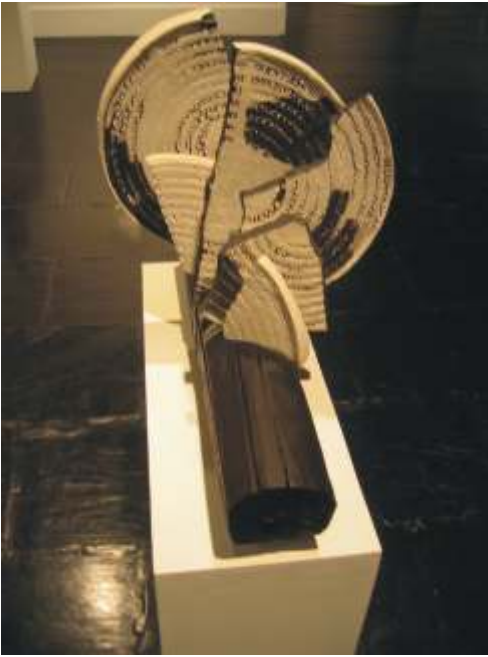
Composición con placas I (92-95) Refractorio, óxido y madera.

otra. No soy influenciado por lo que pueda ver en los demás, sí me influye mi vida. Con esto quiero decir que mi lenguaje no es ajeno a lo que me rodea, al paisaje, la música, la lectura, el olor, los ruidos, el silencio, el tiempo, todo me influye.