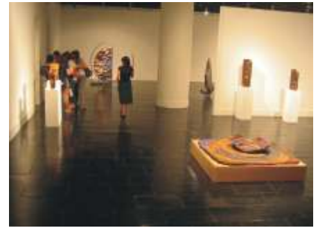
Cuenco sobre placa (1990-91) Refractario y óxido

Quisiera antes de despedirnos que me dijeras qué te ha parecido nuestra Beca de Escultura en Barro A. Ariza, ¿Crees que aún son necesarios estos encuentros de artistas?