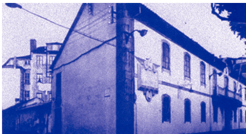
Antigo concello. / 1