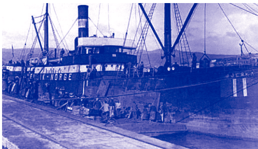
Sociedade de Descargadoras e Cargadoras do Peirao 1909. / 7