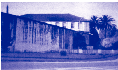
Porta de Bazán aos Cantóns tapiada tras os sucesos de Marzo de 1972. / 10