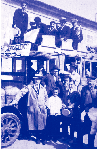
Excursión Centro Obrero de Cultura. Anos 20. / 5