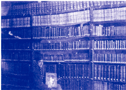
Biblioteca do Centro Obrero de Cultura. / 5