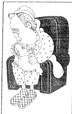
O amor manda